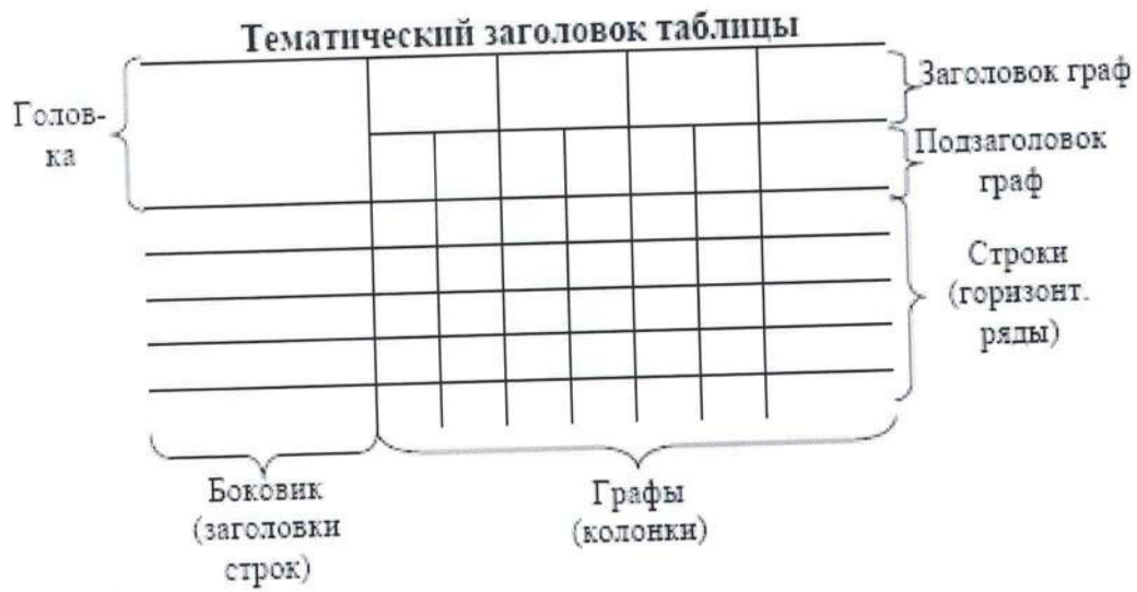
Рисунок 1. Структура таблицы